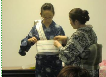
ゆかた着付け教室