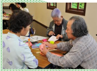
大人のための知って得する折り紙教室