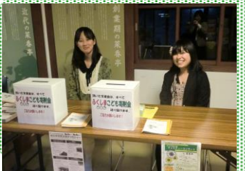
チャリティーコンサートの運営スタッフ