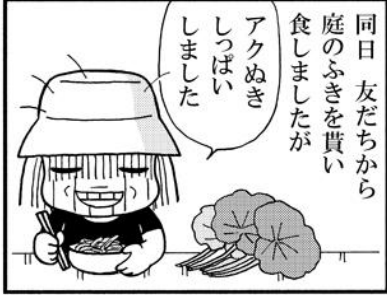
同日 友だちから庭のふきを買い食しました。アクぬきしっぱいしました。